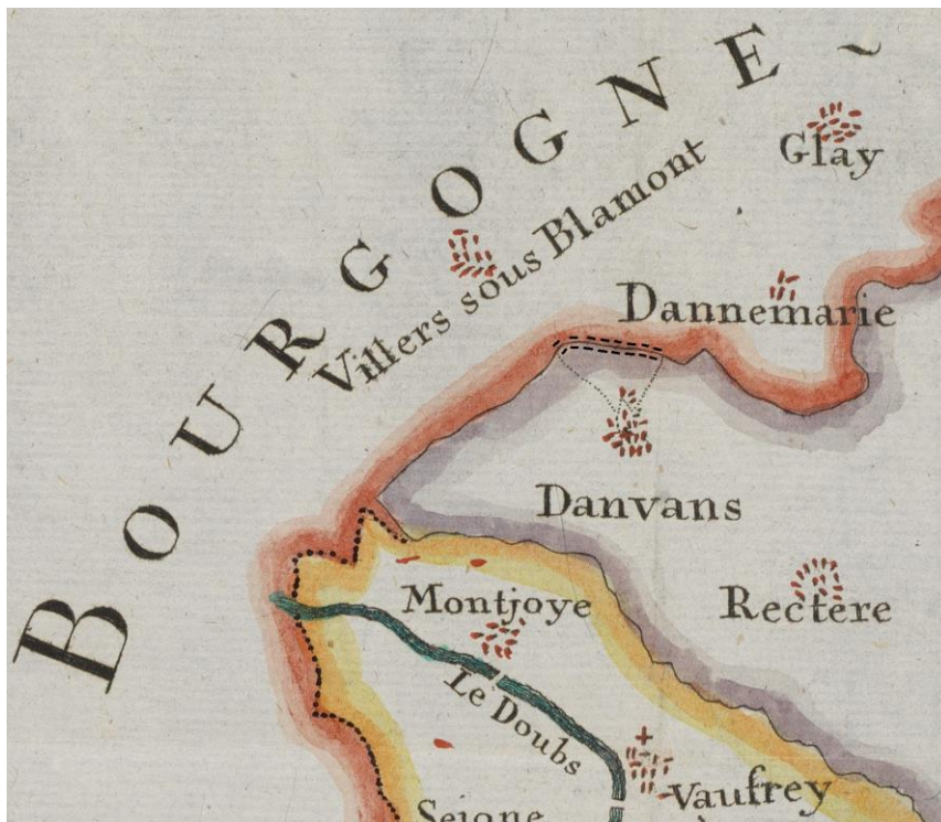
Détail de la carte topographique de l'échange du 20 juin 1780 (AAEB, B 207/11-1)

Mais comment se fait-il qu'une communauté du bailliage d'Ajoie, relevant de la principauté épiscopale, compte des sujets français parmi ses bourgeois ? La situation, à haut potentiel conflictuel, date de bien avant l'affaire Saunier.