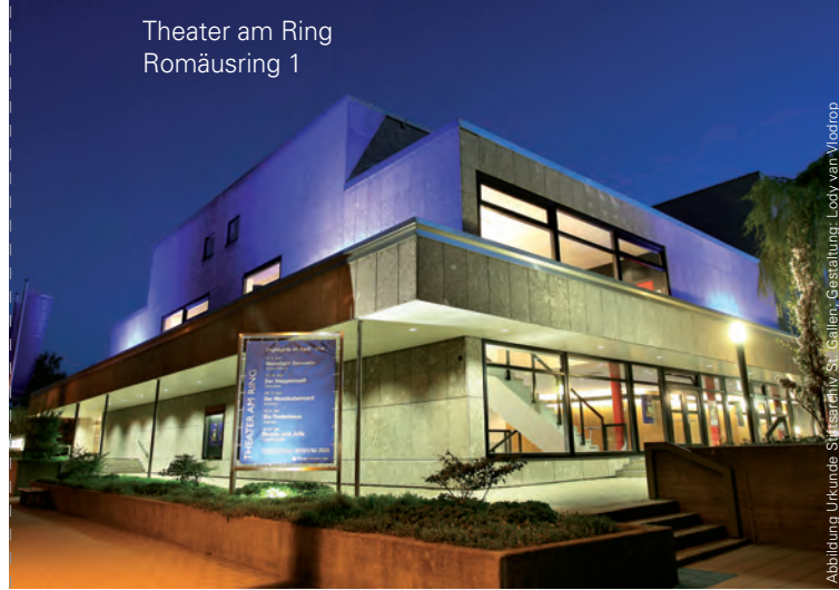
Abbildung Urkunde Spitzsärliv St. Gallen, Gestaltung: Lody van Vlodrop

Die Veranstaltung findet im Kleinen Saal des Theaters am Ring im Stadtbezirk Villingen statt. Eine Anmeldung beim Stadtarchiv ist erwünscht.