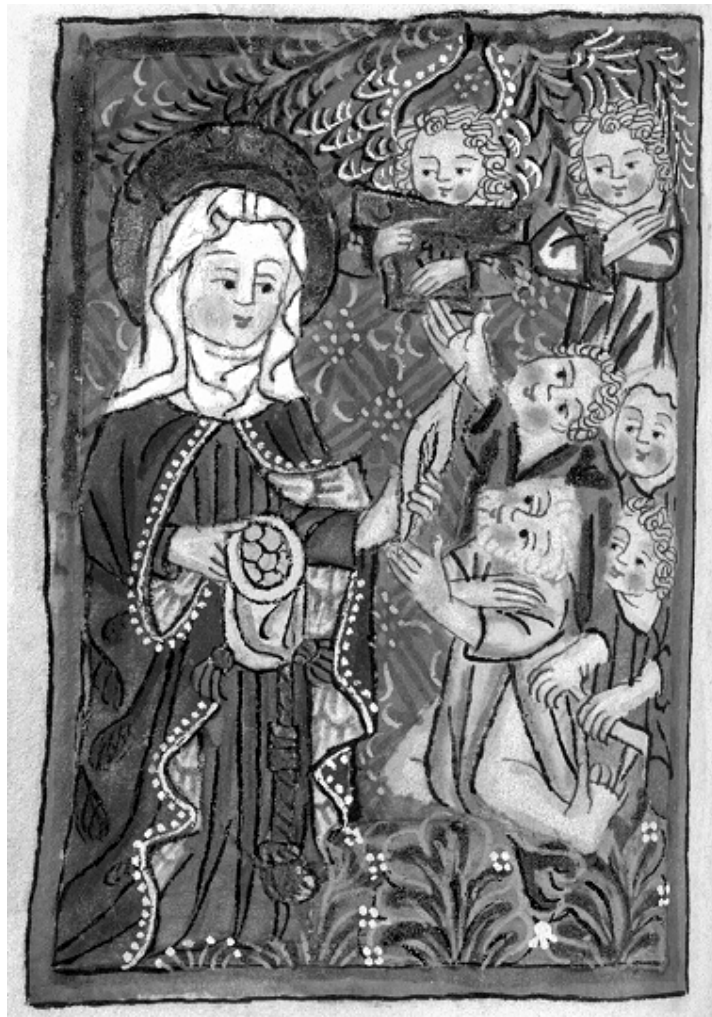
Die hl. Elisabeth verteilt Brot und Geld an Arme und Kranke. Elisabeth-Handschrift des Klosters St. Klara Freiburg